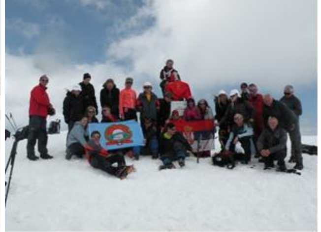
Pobedaši na Vihrenu