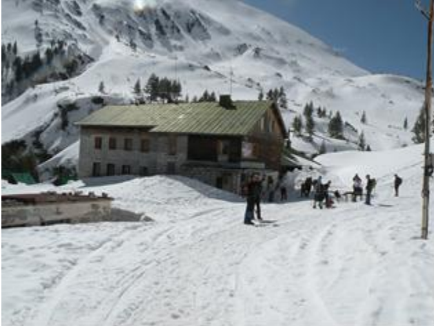
Pl. dom Vihren(1950m)